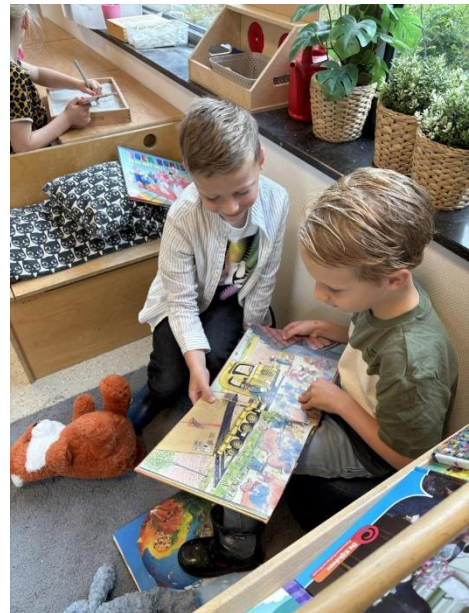
Samen genieten van een prentenboek in 1/2A