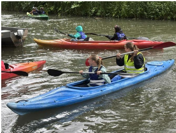
Groep 8 op kamp in de regen, maar wel met heel veel plezier

Alleen als je bovenstaande oproep volgt kunnen we garanderen dat jouw kind een plek bij ons op school krijgt.